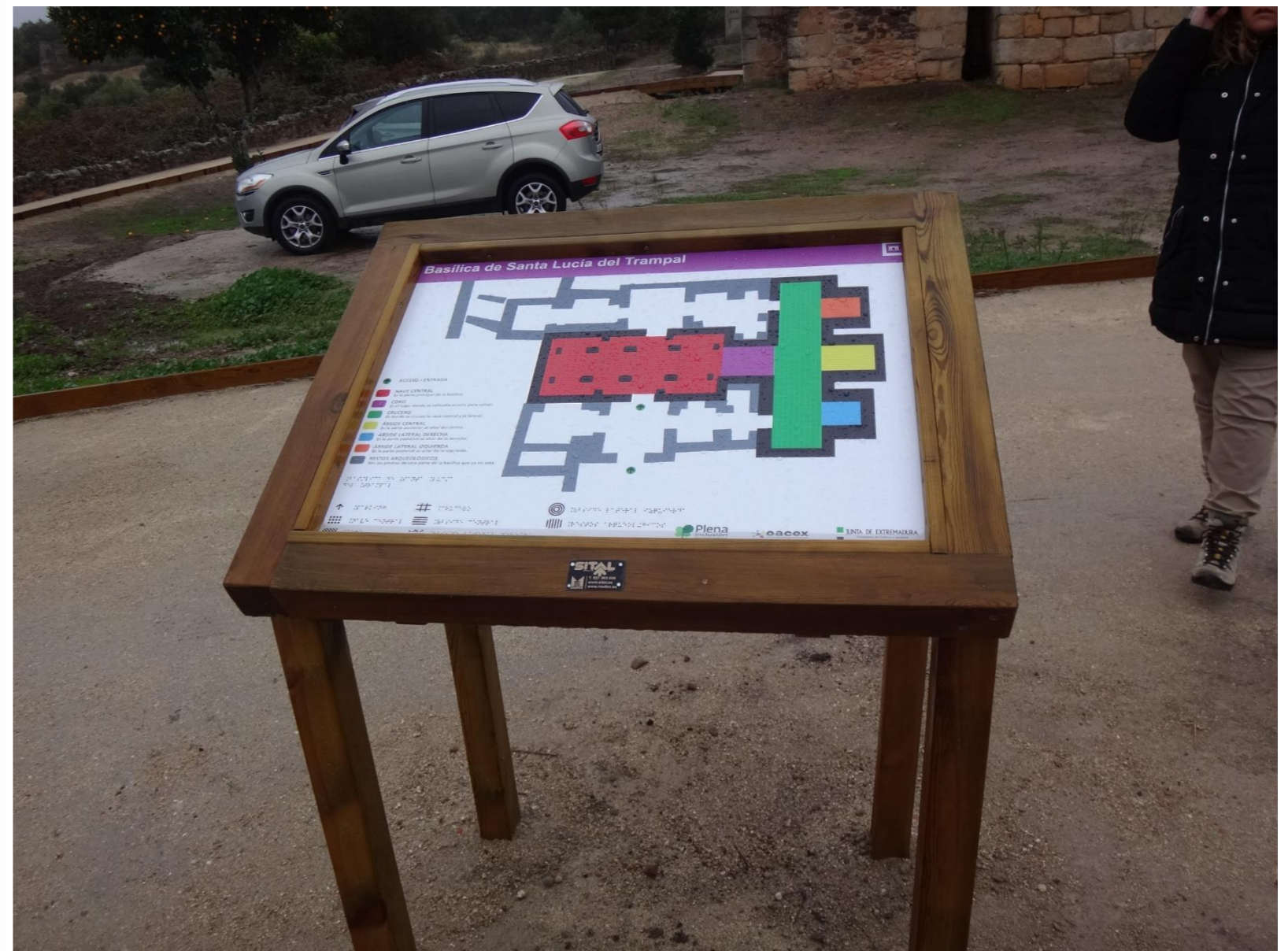
ACTUACIÓN REALIZADA EN EL ENTORNO