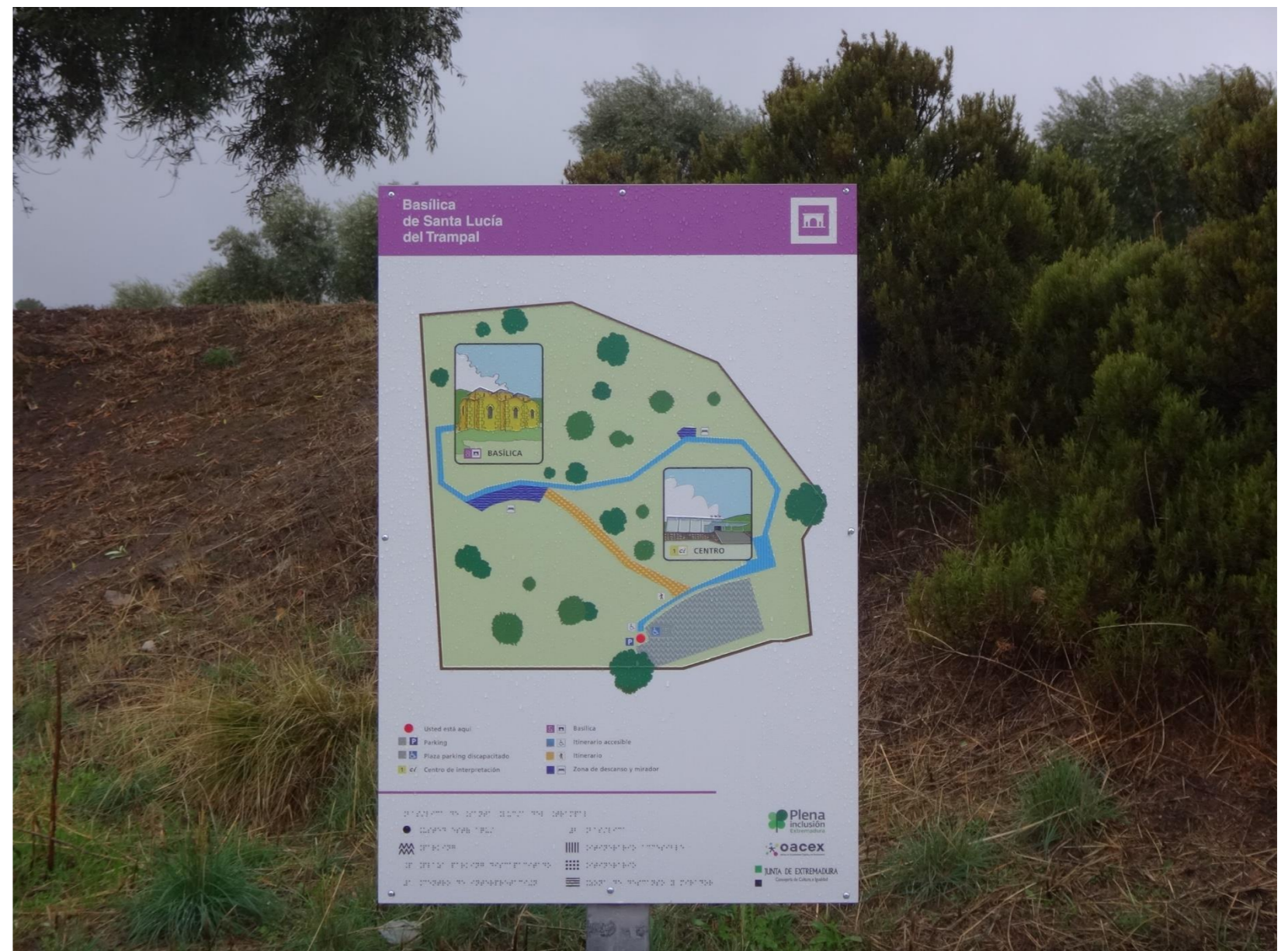
ACTUACIÓN REALIZADA EN EL ENTORNO